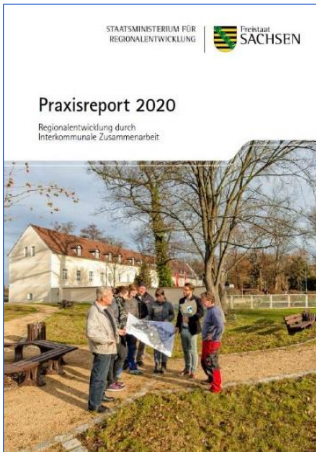
Broschüre „Praxisreport 2020 – Regionalentwicklung durch Interkommunale Zusammenarbeit“