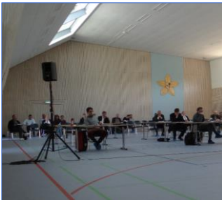
Verbandsversammlung „mit Abständen“ am 07.05.2020 in Großpösna