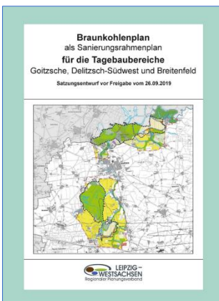
Satzungsentwurf des Sanierungs- rahmenplans vom 26.09.2019

Die Genehmigung enthält keinerlei Auflagen, so dass keine nochmalige Befassung unserer Verbandsorgane etwa für einen Beitrittsbeschluss erforderlich ist. Wir können damit die Endausfertigung vornehmen, die notwendige Bekanntmachung veranlassen und das Planwerk noch im laufenden Jahr in Kraft setzen. Auch die Druckfassung wird mit dem Inkrafttreten des Planwerks verfügbar sein.