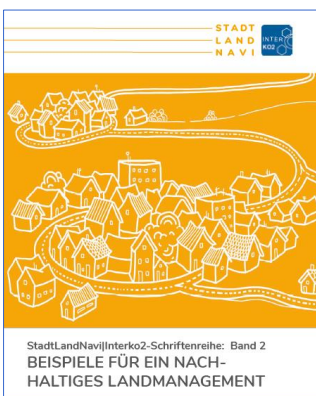
Broschüre der Forschungsprojekte Stadt-Land-Navi/Interko2 – Band 2