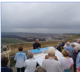
Besucherguppe des Erzgebirgsvereins am Aussichtspunkt des Tagebaus Vereinigtes Schleenhain“

https://publikationen.sachsen.de/bdb/artikel/36107