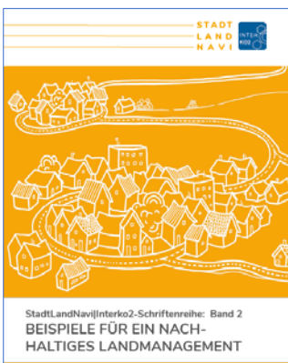
Broschüre der Forschungsprojekte Stadt-Land-Navi/Interko2 – Band 2

https://publikationen.sachsen.de/bdb/artikel/36107