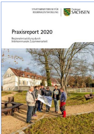
Broschüre „Praxisreport 2020 – Regionalentwicklung durch Interkommunale Zusammenarbeit“

Auf der Grundlage der 1. Richtlinie des Sächsischen Staatsministeriums für Regionalentwicklung zum Sächsischen Strukturentwicklungsprogramm in den Braunkohlerevieren vom 31.08.2020 ist die Etablierung Regionaler Begleitausschüsse unter Einbeziehung der Träger der Regionalplanung mit beratender Stimme vorgesehen.