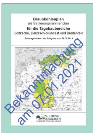
Genehmigte Satzung des Sanierungsrahmenplans gemäß § 7 Abs. 2 LPlVG

Mit dem Satzungsbeschluss hat der Regionale Planungsverband seinen politischen Willen zur Entwicklung der Planungsregion Leipzig-West Sachsen dokumentiert. Der Plan besitzt damit schon jetzt die Qualität eines öffentlichen Belangs.