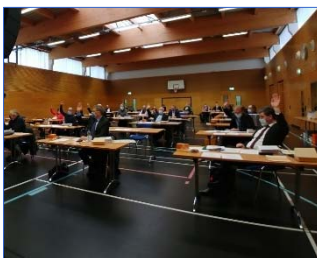
Beschlussfassung am 11.12.2020 in der Verbandsversammlung in Zwenkau