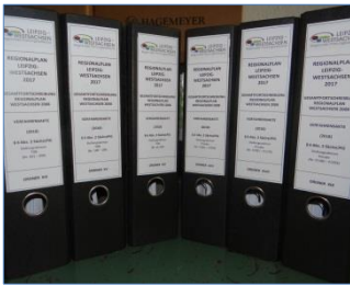
Abwägungsunterlagen zur öffentlichen Anhörung des Beteiligungsentwurfs nach § 6 Abs. 2 SächsLPlIG

Newsletter des Regionalen Planungsverbands Leipzig-West Sachsen 1/2018