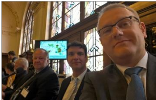
Kommissionssitzung vom 24.09.2018 in Halle (Saale)

350.000 € im nächsten Jahr haushaltswirksam werden könnten, gemeldet. Ergänzend zur sonstigen Förderung erfolgte im Jahr 2018 durch das Sächsische Staatsministerium des Innern in Umsetzung des „Zukunftspaktes Sachsen“ der Aufruf „Verbesserung der interkommunalen Zusammenarbeit als Modellprojekt fördern“. Von den sachsenweit 25 eingereichten Vorhaben wurde das Vorhaben „Aufbau eines kommunalen IT-gestützten Dienstleistungszentrums für den Aktionsraum Wurzener Land“ des Wurzener Landes als eines von drei Vorhaben als Modellprojekt für eine Förderung priorisiert.