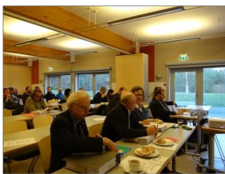
Verbandsversammlung in Naunhof

Zum OVG-Urteil lag bei Redaktionsschluss eine Entscheidung des Klägers dahingehend, ob er Revisionsnichtzulassungsbeschwerde einlegt, noch nicht vor.