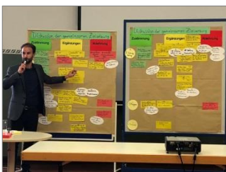
Stadt-Land-Navi – Kick-Off-Treffen vom 04.09.2018 in Leipzig