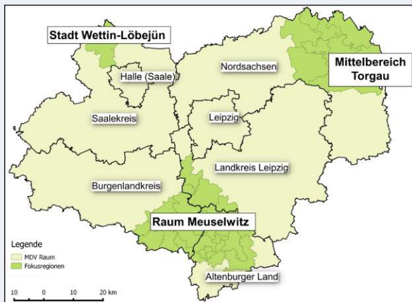
Untersuchungsraum und Fokusregionen.