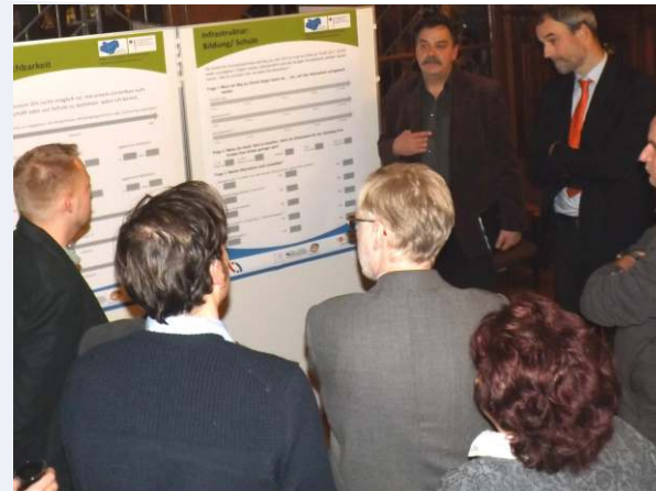
26. Januar 2015: Zwischenbilanz in Halle (Saale).

Auswertung und Diskussion der Umsetzbarkeit von lokalen Strategien und spezifischen Handlungsmöglichkeiten mit lokalen Akteuren